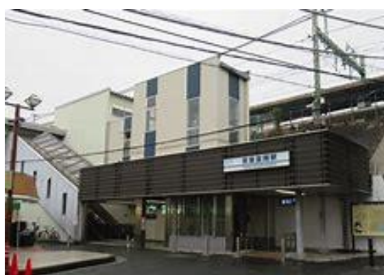
No36. 京急富岡駅 20050813 (土) 17:05 ネットより