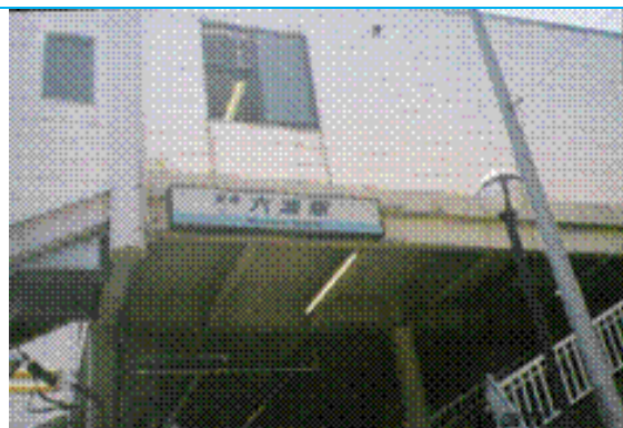
No61. 六浦駅 20050820 (土) 11:25