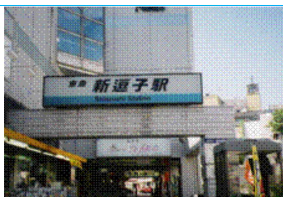
No63. 逗子葉山駅 (新逗子駅) 20050820 (土) 10:00