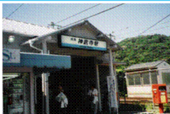
No62. 神武寺駅 20050820 (土) 10:43