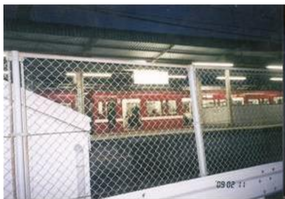
No23. 神奈川新町駅 20090211 (水) 17:32