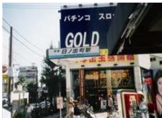
No28. 日ノ出町駅 20050820 (土) 14:35