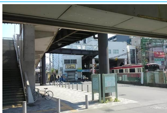
No21. 京急新子安駅 20090211（水）17:07