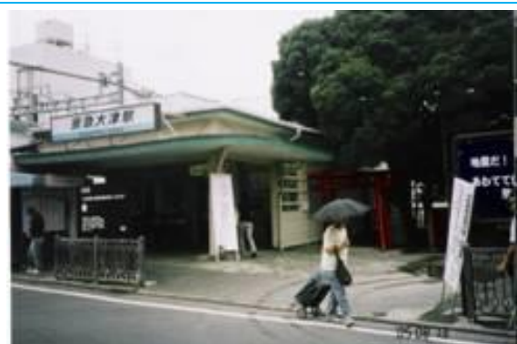
No48. 京急大津駅 20050813 (土) 11:10