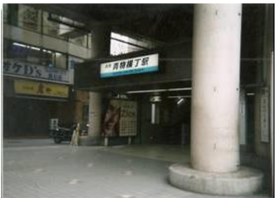
No5. 青物横丁駅 20090211 (水) 11:36