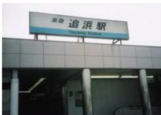
No40. 追浜駅 20050813 (土) 15:12