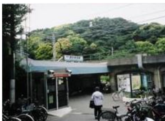
No57. 津久井浜駅 20050611 (土) 13:40