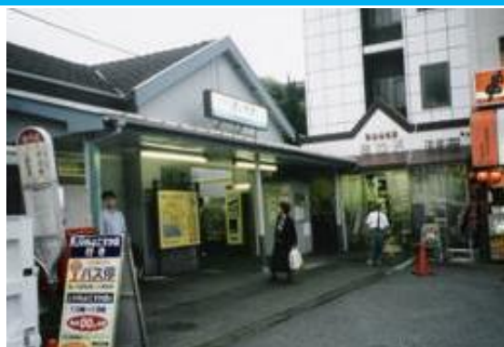
No51. 堀ノ内駅 (再掲) 20050611 (土) 17:50