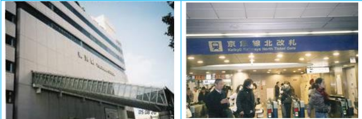
No26. 横浜駅 20050820 (土) 16:30