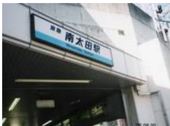
No30. 南太田駅 20050820 (土) 14:00