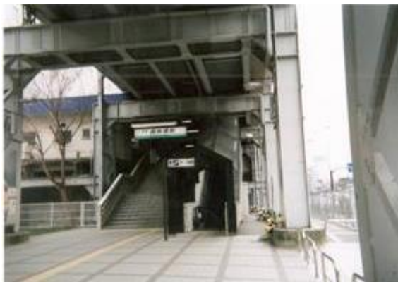
No4. 新馬場駅 20090211 (水) 11:20