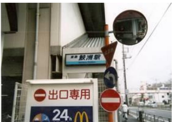
No6. 鮫洲駅(さめず) 20090211 (水) 11:45