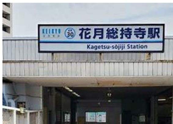
No19. 花月総持寺駅（花月園前駅） 20090211（水）16:28