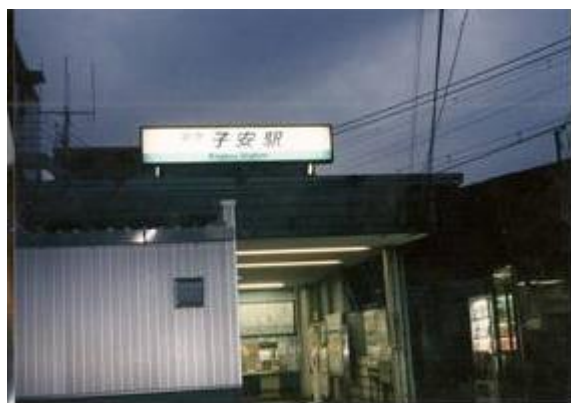
No22. 子安駅 20090211 (水) 17:20