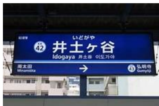
No31. 井土ヶ谷駅 20050820 (土) 13:35