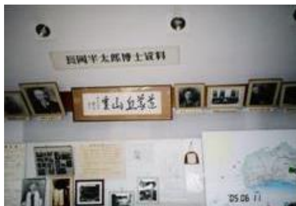
長岡半太郎記念館 14:25