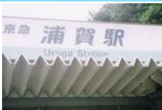
No50. 浦賀駅 20050813 (土) 10:25