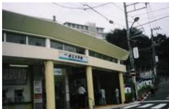
No46. 県立大学駅 20050813 (土) 11:50