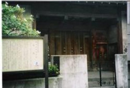
赤門 横須賀市制施行 70 周年記念、横須賀風物百選 (武家屋敷の主門) 11:55