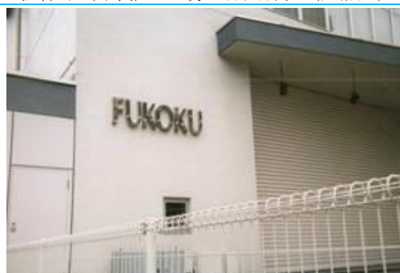
Np9. 平和島駅 20090211 (水) 12:58