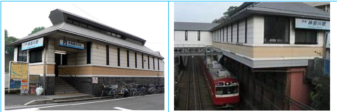
No25. 神奈川駅 20090211 (水) 18:01 ネットより