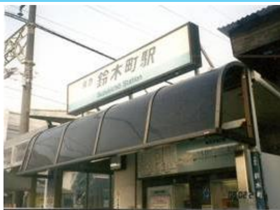
No73. 鈴木町駅 20090221 (土) 16:50