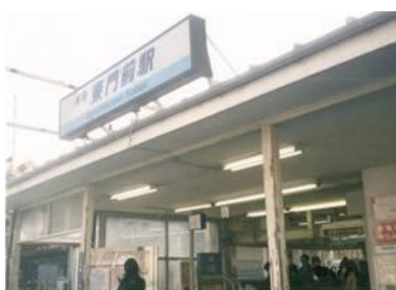
No75. 東門駅前 20090221 (土) 16:06