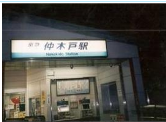
No24. 京急東神奈川駅 (仲木戸駅) 20090211 (水) 17:46