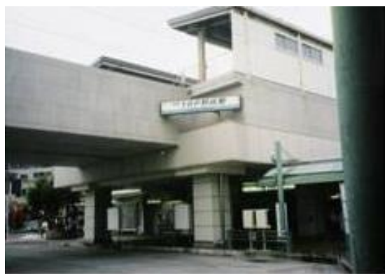
No55. YPP 野比駅 20050611 (土) 15:00