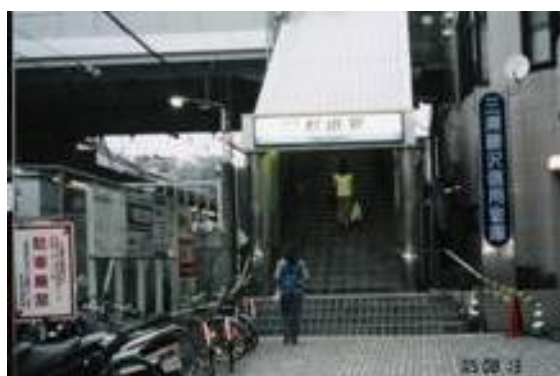
No35. 杉田駅 20050813 (土) 17:55