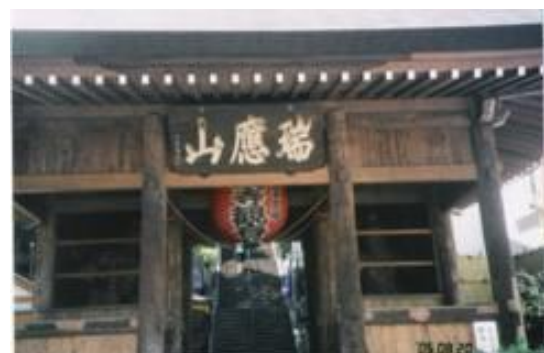
No32. 弘明寺駅 20050820 (土) 13:12