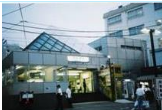
No34. 屏風浦駅 20050813 (土) 18:15