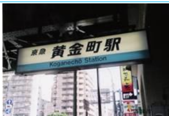
No29. 黄金町駅 20050820 (土) 14:15