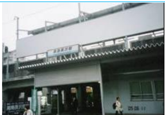
No56. 京急長沢駅 20050611 (土) 14:05