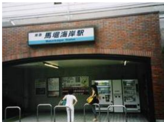
No49. 馬堀海岸駅 20050813 (土) 10:55