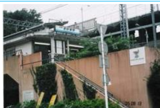
No42. 安針塚駅 20050813 (土) 13:45