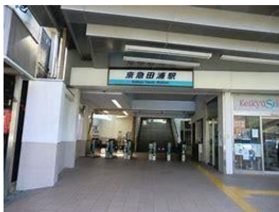
No41. 京浜田浦駅 20050813 (土) 14:45