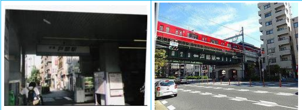
No27. 戸部駅 20050820 (土) 16:10