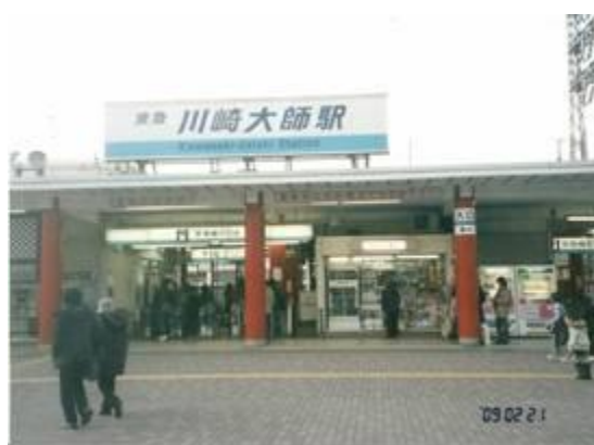
No74. 川崎大師駅 20090221 (土) 16:38