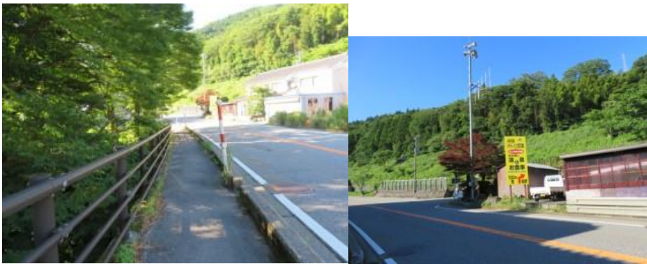
※国道 41 号線を歩く