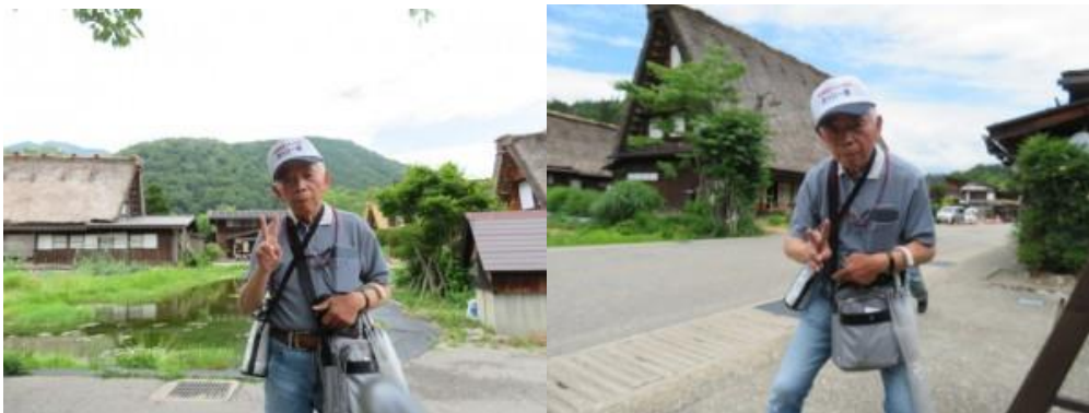
⑧今回も旅先で多くの人と出会うことができた。