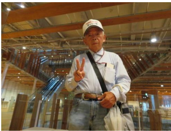
※富山ガラス美術館

⑦歩き鉄の間に観光を入れる重要性を強く痛感した。足腰の休養もできるからだ。お陰で長年の夢であった白川郷にも立ち寄ることができた。