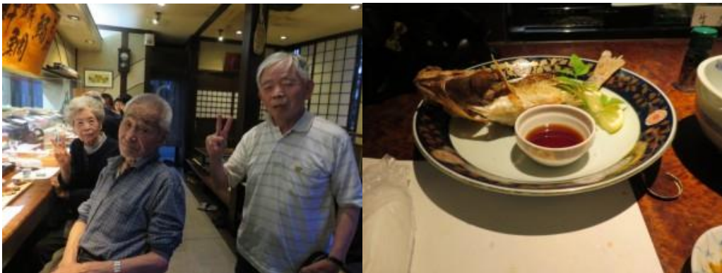
※寿楽久で楽しいひと時