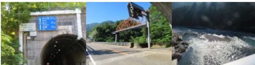
※猪谷トンネルを通り抜け誤った方向に進行