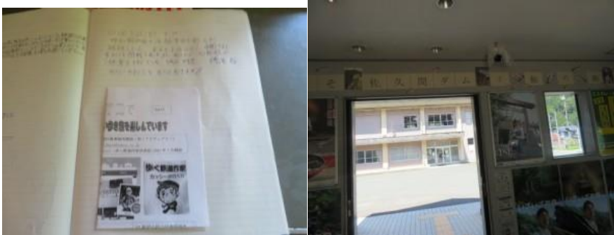
※ノートに本日小和田訪問のメモ、中部天竜駅