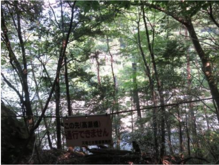
※高瀬橋決壊で通行止め