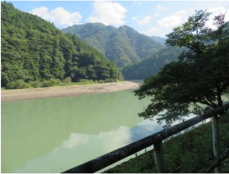
※7月17日（水）対岸から小和田駅界隈を推定した地点