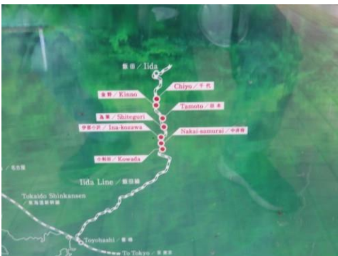
※秘境駅（小和田、中井侍、伊那小沢、為栗、田本、金野、千代）